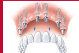
Im Oberkiefer: Brücke auf sechs Implantaten