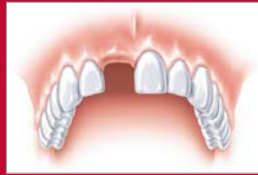
Ein verlorener Zahn z. B. durch einen Sportunfall

Anschließend wird darauf „unsichtbar“ und dauerhaft stabil Ihre neue Zahnkrone befestigt. Sie sitzt mit ihrer neuen Wurzel fest im Kiefer und ist von den natürlichen Nachbarzähnen nicht zu unterscheiden.