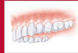
Natürliche Ästhetik, natürliche Funktion

Ohne Implantate kann der Kiefer nur als „Auflagefläche“ für den Zahnersatz dienen. Fixiert wird der herausnehmbare Zahnersatz an einem oder mehreren Zähnen.