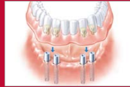
Unterkieferprothese auf vier Implantaten

Dauerhafter Prothesenhalt wird ohne Implantate fast nie erreicht. Der Knochen im zahnlosen Kiefer bildet sich zurück – die Prothese „wackelt“.