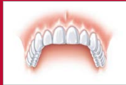
Eine natürlich geschlossene Zahnreihe

Bei einer konventionellen Versorgung ohne Implantat muss die Zahnkrone an den Nachbarzähnen fixiert werden.