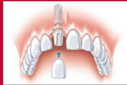
Das eingesetzte Implantat mit der neuen Zahnkrone