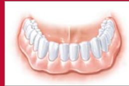
Die Prothese sitzt fest